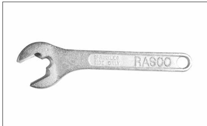
Rys. 3 – Klucz do Modelu N1

Są to tryskacze wczesnego gaszenia szybkiego reagowania (ESFR), wiszące, pracujące w trybie gaszenia, które zostały specjalnie przetestowane i posiadają aprobatę (są zatwierdzone przez FM) do zastosowań przy magazynowaniu towarów. Rama i deflektor tryskacza mają konstrukcję z brązu. Zespół łącznika topikowego działa na zasadzie rozporowo-dźwigniowej z atestowanym berylowo-niklowym elementem termicznym malowanym na kolor czarny lub biały. Uszczelnienie wodne składa się z pokrytej Teflonem podkładki sprężystej Bellville i zespołu mosiężnej zaślepki bez elementów z plastiku. Tryskacze ESFR mają nominalny współczynnik K 25,2 i gwintowane złącza końcowe 1" NPT. Temperatura