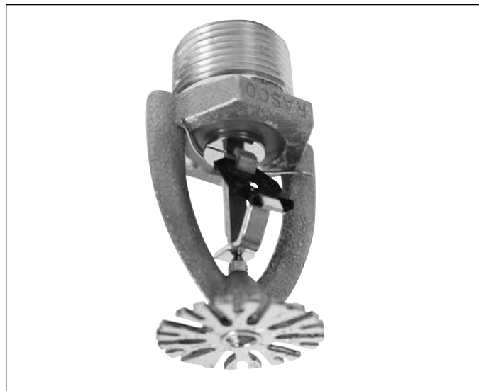
Tryskacz wczesnego gaszenia szybkiego reagowania ESFR Model N25

Maksymalny odstęp: 12 stóp (3,7 m) dla budynków do 30