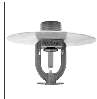
Modèle F156 Sprinkleur de niveau intermédiaire pendante