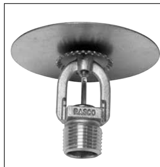
Modèle F1FR56 Sprinkleur de niveau intermédiaire debout