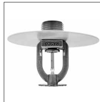
Modèle F1FR56 Sprinkleur de niveau intermédiaire pendante