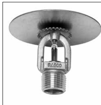
Modèle F156 Sprinkleur de niveau intermédiaire debout

Les sprinkleurs avec ampoule en verre sont pourvus de couvercles de couleur orange destinés à protéger l'ampoule pendant le processus d'installation. RETIRER CETTE PROTECTION SEULEMENT APRÈS LA RÉALISATION D'UN TEST HYDRAULIQUE SUR LE SYSTÈME. Les clés de modèle D et de modèle GFR2 sont conçues pour l'installation des sprinkleurs équipés de couvercles.