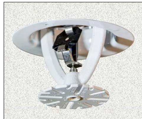
Colgante empotrado (solo UL)