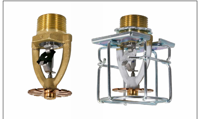
Modelo N252EC colgante (con guarda K25 opcional, derecha)

El rociador modelo N252EC ofrece un área de cobertura máxima de 14 pies por 14 pies (196 pies 2 ), que es casi el doble de lo que proporcionan los rociadores de cobertura estándar. Esto ofrece la ventaja de disminuir el número total de rociadores, reduciendo los costos de mano de obra y materiales.